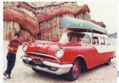
WYNN HAMMER UNTITLED PHOTOGRAPH 1967